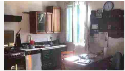
Appartamenti Mestrino Guido Negri - 42000

Insomma: l'imprenditore che realizza milioni di bottiglie di Prosecco e tanti altri vini e distillati che esporta in oltre 140 Paesi, riconosce alla semplicità della cucina territoriale un valore aggiunto per il comparto vinicolo: «Mettere insieme le ricette e le loro storie, spiegare di un piatto non solo la preparazione ma anche nei suoi ingredienti e dal punto di vista della tradizione che rappresenta, è stata per me un'esperienza eccezionale, un viaggio nella storia delle mie colline con il quale spero di averle valorizzate per tutto quello che rappresentano».