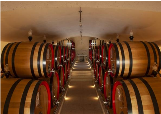
große Weine reifen wie Amarone della Valpolicella DOCG

Zwei eigene Top-Weingüter: Valgatara sowie das in der Montalcino-Region