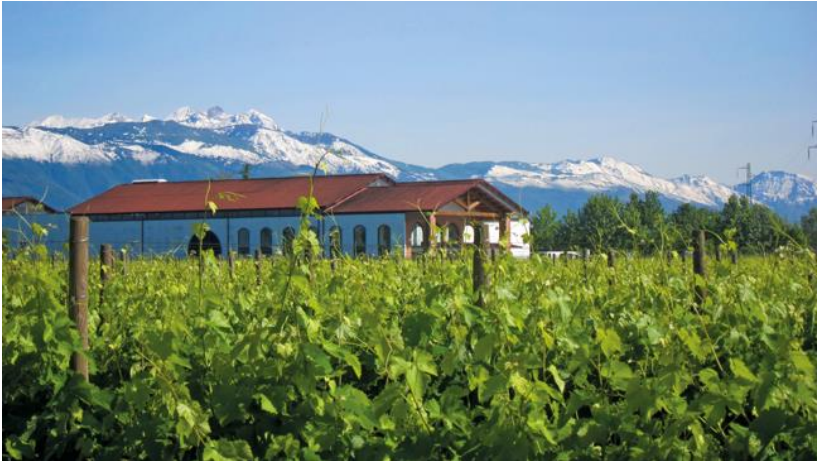
Das Haupthaus Bottega von der