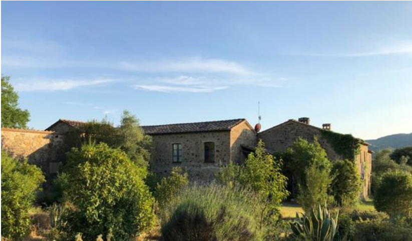
Das Weingut von Bottega in der Top-