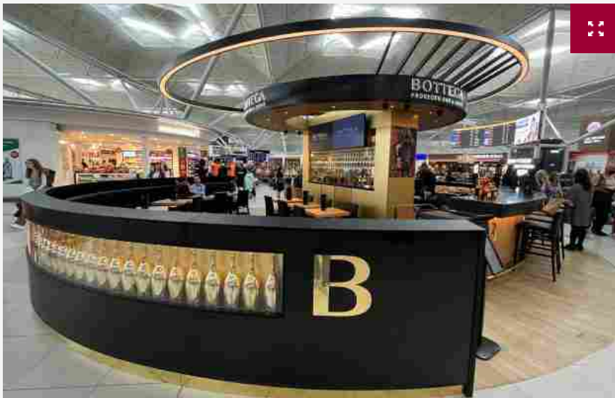
Il Prosecco Bar by Bottega all'Aeroporto di Stansted, a Londra, con il Prosecco Gold

Nel 2021 che ha segnato, almeno in parte, la ripartenza del turismo mondiale, poi consolidata nel 2022 appena concluso, il business delle vendite in stazioni, porti, aeroporti e crociere, il cosiddetto “Travel & Retail”, ha mosso poco più di 50 miliardi di euro in totale, di cui 12 rappresentati dal settore “Wine & Spirits”, seconda voce più influente dopo quello dei cosmetici. D'altronde, chiunque viaggi per lavoro o per diletto, è quasi praticamente obbligato a passare un po' di tempo a vagare tra scaffali