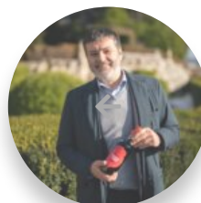
Masi: less is more