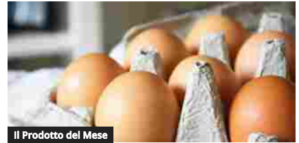
Il Prodotto del Mese